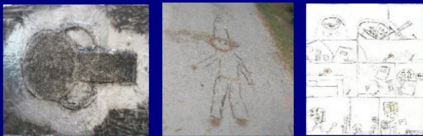
Alix, 11 ans/carton/alu/gouache Noa, 8 ans/éléments de la nature Arthur, crayon bic sur papier

25/26/27/28 JUILLET au Beaucet rte. de St Gens: 9h30 – 12h30