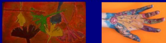
Jason, 10 ans/pastel/feutre/encres sur papier Elodie, 11 ans/peinture/stylo

Maximum 10 inscrits – 65 euros le stage de 4 jours.