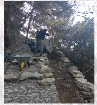
Aménagement d'une grande jardinière (terre offerte par Ets Maurizot)