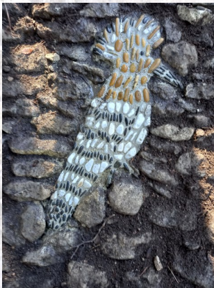
La huppe facié