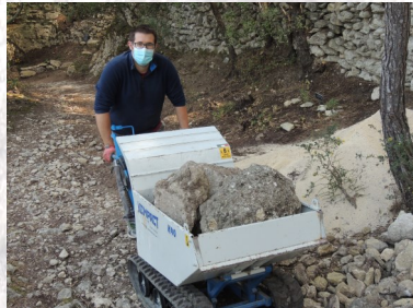
Des petites pierres !