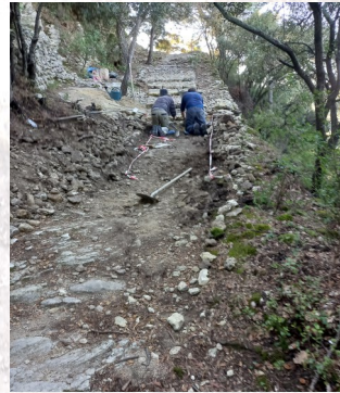
2 beaux spécimens de Caladaïres à l'ouvrage