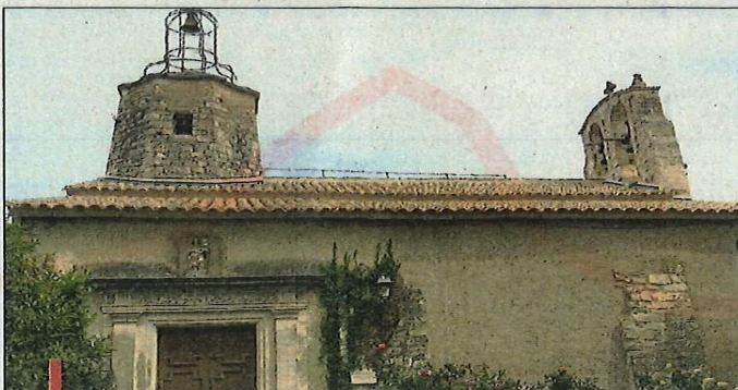
L'église de l'Assomption et son nouveau toit de tuiles canal.

La pose, le 7 juin, de sept jarres d'Anduze rue du chemin de Ronde et la fin des travaux de la salle Antonella et de la toiture de l'église de l'Assomption, permettent à ce village de calades et de restanques de poursuivre sa politique de valorisation du patrimoine. Autre exemple de cette politique volontariste, la rue Coste-Chaude, longue de 800 mètres, va devenir, elle aussi, une calade. La consultation des habitants doit débuter à la rentrée de septembre. Les travaux doivent être finis avant la fin de la mandature, en 2026.