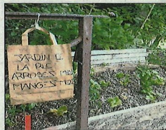
Le "jardin éphémère" de l'association "Comme une maison" rue Coste-Chaude. Michel Bigonzi et une jarre d'Anduze.

"La municipalité les a agrémentés de lauriers roses et blancs donnés par la pépinière Morizot. Cela permet de créer un cadre de vie fleuri. Un bien-être indispensable après six mois de confinement" souligne l'élu. Et de poursuivre : "pour inciter les habitants à fleurir le village, un bon de 15€ est proposé par la pépinière Maurizot Demeneix. Les villageois ont pour seul engagement de planter des fleurs visibles de la rue. Cela fonctionne plutôt bien".